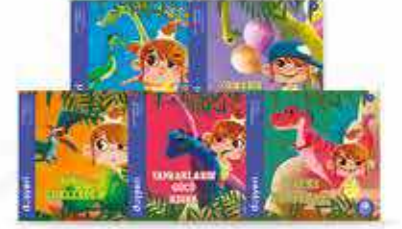
Dinozorlar Serisi 5 Kitap