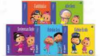
İlk Öykülerim Serisi 5 Kitap