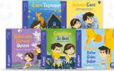
Felsefe Serisi 5 Kitap

Düşyeri Kitap'ın tüm serilerine www.dusyeri.com adresinden ulaşabilir ve alabilirsiniz.