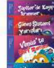
Gezegenler Serisi 10 Kitap