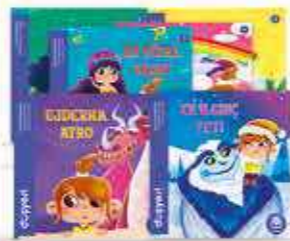
Fantastik Canlılar Serisi 6 Kitap