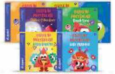
Şekiller Serisi 6 Kitap