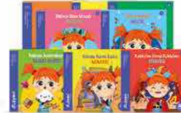
Sanat Dalları Serisi 8 Kitap