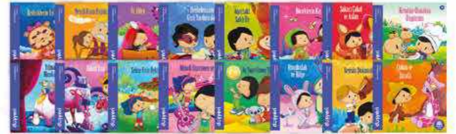
Öyküler Serisi 16 Kitap