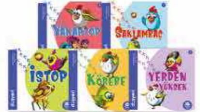
Sokak Oyunları Serisi 5 Kitap